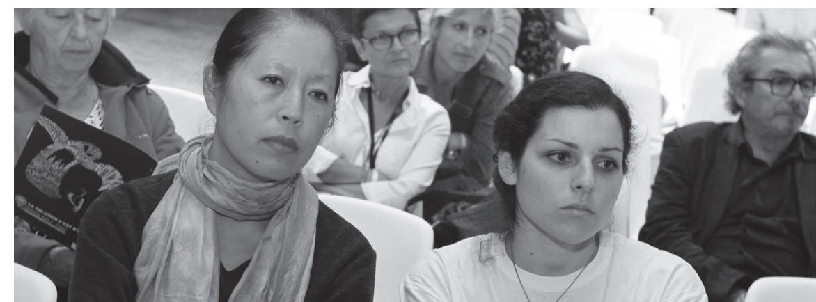
CARTON ROUGE pour la FIFA initiative présentée à la Fête de l'Humanité nous a permis de recueillir près de 9 500 signatures au travers de la carte pétition. Nous avons

pu aussi durant les deux débats du vendredi soir et du dimanche argumenter sur la démarche que nous menons et de notre combat.